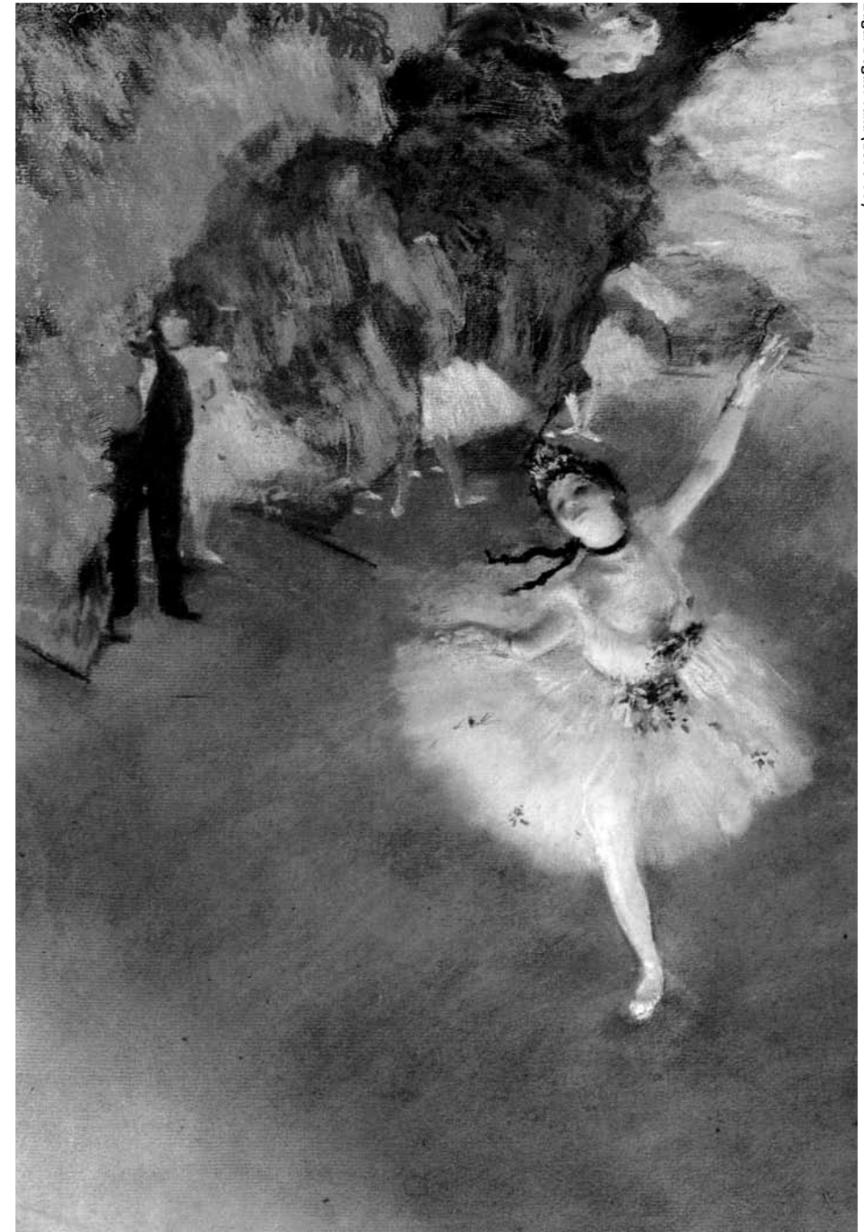
Edgar Degas: Tänhti (1876-77)

Tulevaisuudessa töitä ei ehkä tekisikään enää itseään luonnottomiin asentoihin vääntävä mukautuja, vaan pelimies tai -nainen, joka myy itsensä kalliilla ja ajattelee, että työnantajalle on etuoikeus olla juuri hänen kiinnostuksen kohteenaan. Työntekijän edessä seisoi mies tai nainen, joka käyttäytyisi palkinnon tavoin. Siinä vaiheessa kun työnhakijalla on pokkaa ruumiillistaa työnantajalle ”musta tuntuu, että te tarvitsette enemmän mua kuin mä teitä” -ajatus, ollaan hyvää vauhtia matkalla kohti työntekijän markkinoita. ●